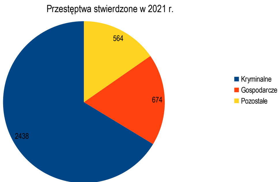
Wykres nr 1

Kolejny wykres nr 2 przedstawia zagrożenie przestępczością uznawaną za najbardziej uciążliwą dla społeczeństwa.